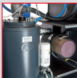
Mantenimiento fácil y rápido

El nuevo elemento y la caja de engranajes combinados con un aislamiento acústico superior dan como resultado un reducido nivel sonoro.