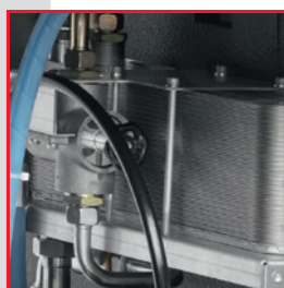
Recuperación de energía (opcional)

Una única unidad de control, especialmente programada para el ahorro de energía. ES4000 avanzado como una opción.